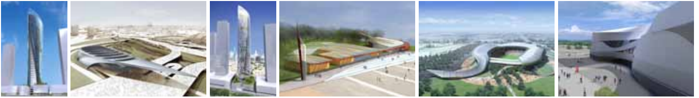
Torre Damac Centro Acquatico Londra 2012 Torre a Dubai Chiesa ai Tre Ronchetti Stadio di Le Mans Arena di Sochi 2014