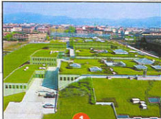
1 Environment Park

In corso Umbria, il parco tecnologico dove si studiano le applicazioni dell'idrogeno